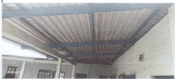
Estructura de metal instalado