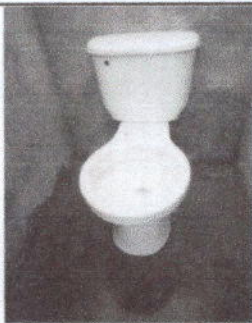
Inodoro nuevo instalado

Observación: Si es necesario se pueden agregar hojas adicionales y actualizar el número de hojas.